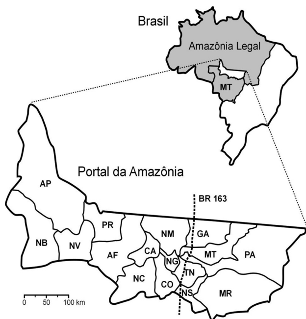
Figura 1 - Mapa do Portal da Amazônia. O Portal da Amazônia encontra-se no Estado de Mato Grosso (MT), na região da Amazônia Legal, no Brasil. Ver material e métodos para a legenda dos nomes dos municípios.

As entrevistas foram realizadas entre julho e dezembro de 2006 nos 16 municípios do Portal da Amazônia: Alta Floresta (AF), Apiacás (AP), Carlinda (CA), Colíder (CO), Guarantã do Norte (GA), Marcelândia (MR), Matupá (MT), Nova Bandeirantes (NB), Nova Canaã do Norte (NC), Nova Guarita (NG), Nova Monte Verde (NV), Nova Santa Helena (NS), Novo Mundo (NM), Paranaíta (PR), Peixoto de Azevedo (PA), Terra Nova (TN). O critério para a escolha dos indivíduos a serem entrevistados seguiu a metodologia da “bola de neve” (Scott 2000), que consiste em entrevistar um número inicial de atores para identificar novos atores a serem entrevistados e assim por diante. O grupo inicial de atores a serem entrevistados foi escolhido a partir da lista dos membros do Conselho Executivo das Ações da Agricultura Familiar (CEAAF), que reúne 60 instituições tais como: Conselhos Municipais de Desenvolvimento Rural Sustentável, prefeituras municipais, membros dos movimentos sociais, ONGs locais, sindicatos rurais patronais, sindicatos de trabalhadores rurais, órgãos públicos, entre outros. Esta lista foi escolhida porque os membros do CEAAF têm um papel relevante nas questões