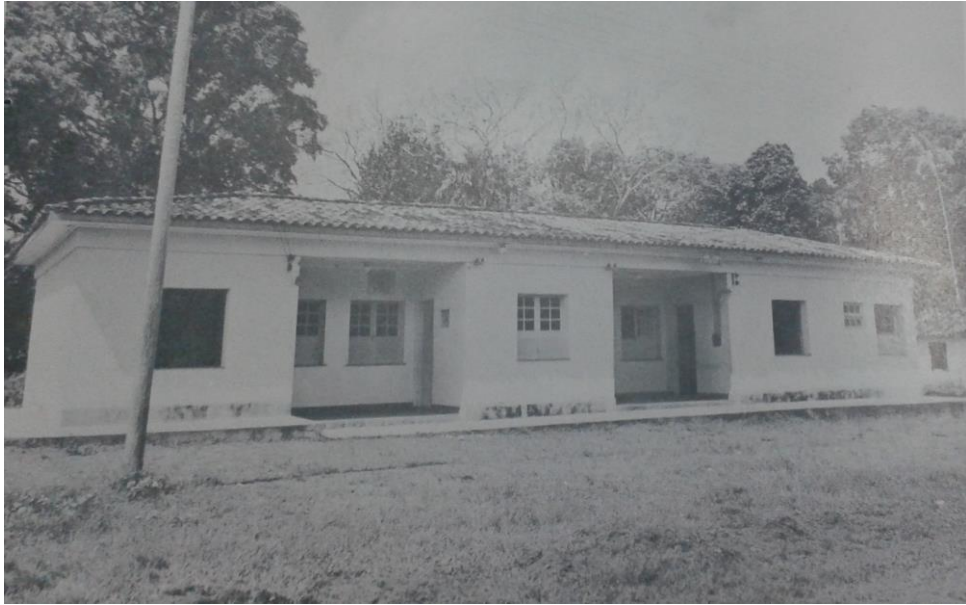
Imagem 03: Prédio onde funcionou a Escola Reunida Doutor Otavio Meira e inicialmente o Grupo Escolar Doutor Otavio Meira. Posteriormente, neste prédio funcionou o Posto médico, coletoria e Posto Policial. (PARÁ, 1971)