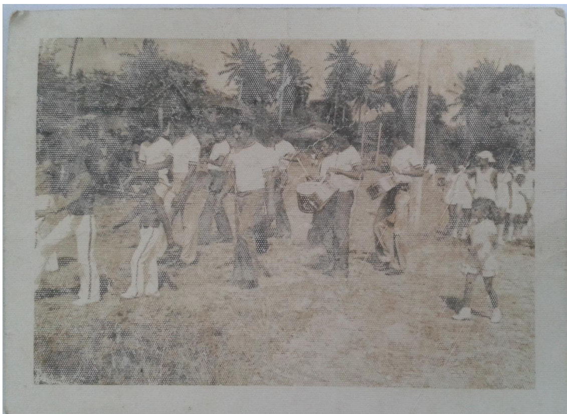
Imagem 01: Desfile cívico 7 de setembro

As professoras relacionam em suas falas o respeito, a ordem com os símbolos nacionais: bandeira e hino. Ensinar o amor à nação formaria cidadãos de respeito, pessoas de boa índole. Os castigos eram presentes na formação de bons hábitos, sejam castigos morais ou físicos. A relação da pátria como nossa mãe para Souza (1998) remete a figura de alguém que cuida, protege.