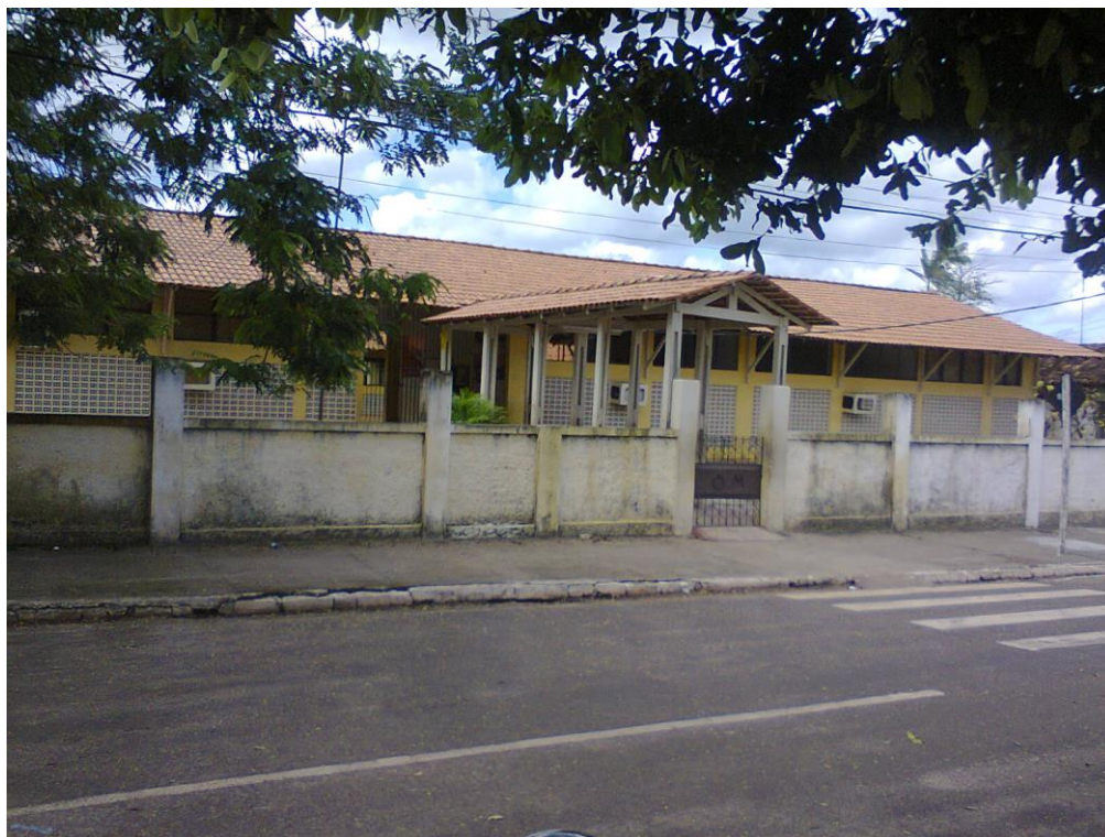
Imagem 06: Fachada atual do Grupo Escolar Doutor Otavio Meira