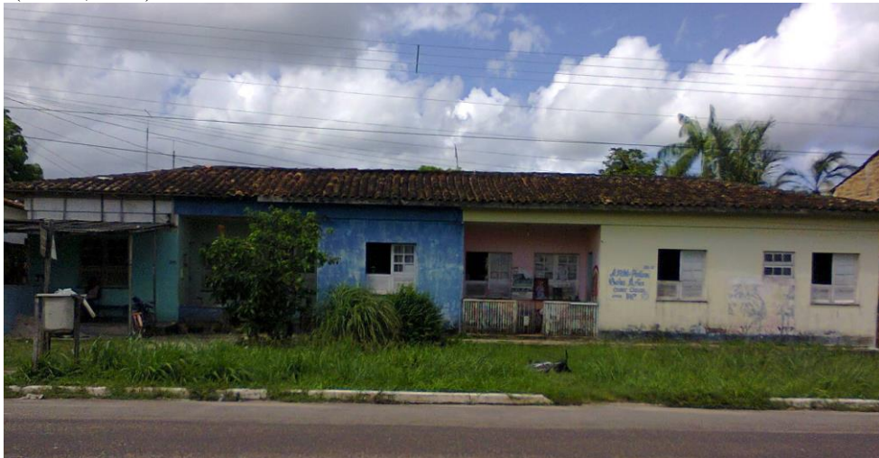
Imagem 04: atualmente, três residências compõem o espaço.