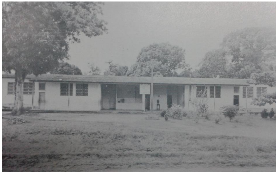
Imagem 05: Grupo Escolar Doutor Otavio Meira (PARÁ, 1971)