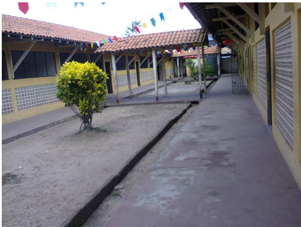
Imagem 07: Área interna do Grupo Escolar Doutor Otavio Meira após a construção do segundo pavilhão de salas de aula.

O Grupo Escolar Doutor Otavio Meira existiu enquanto grupo entre os anos de 1965 a 1976, visto que após a promulgação da lei 5692/1971 extinguiu os grupos escolares, mas os mesmos continuaram funcionando até a conclusão do ensino primário dos alunos que estavam cursando, o que durou até o ano de 1976.