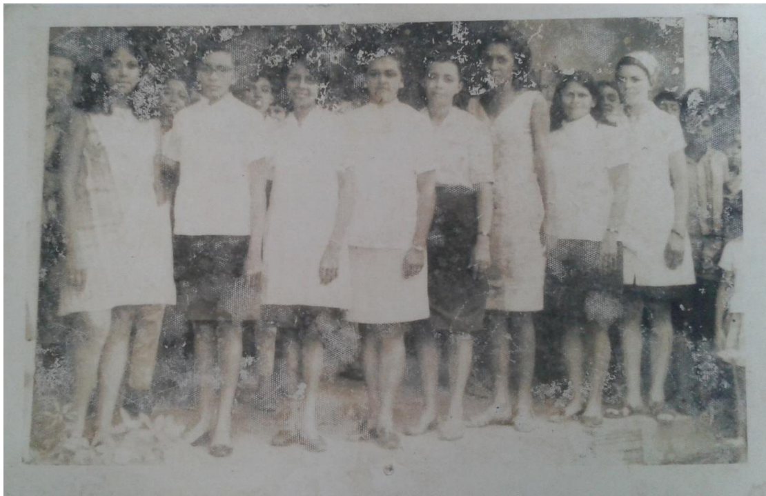
Imagem 08: Docentes do Grupo Escolar Doutor Otavio Meira

A atuação docente no Grupo Escolar Doutor Otavio Meira era influenciada por políticos tanto da esfera estadual quanto da municipal. O conhecimento a respeito das políticas estaduais para o ofício de mestre era baixo, contudo, isso não afetava sua atuação na prática educativa.